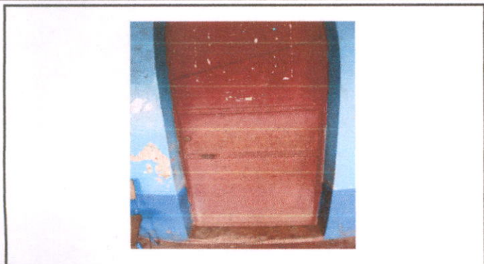
Foto1: Sustitución de chapas en 13 puertas.